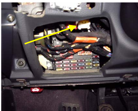
Figura 1: Fusível do ABS: Por baixo do painel de instrumentos, à esquerda, junto da coluna de direcção (LHD)

Em caso de falha repetida dos fusíveis, a detecção da avaria ulterior só deve ser efectuada de acordo com as instruções de verificação do construtor e tendo em consideração o esquema eléctrico. Além disso, a memória de avarias deve ser consultada com uma ferramenta de diagnóstico adequada.