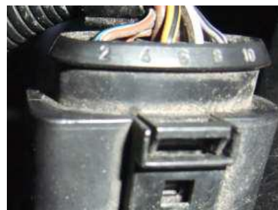
Rysunek 2.: Wtyczka 10-stykowa