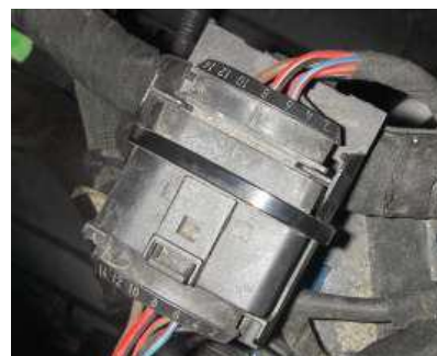
Rysunek 1.: Wtyczka 14-stykowa

Również w przypadku małej ilości miejsca zwracać uwagę na prawidłowe wykonywanie tych czynności! W ten sposób można uniknąć zniszczenia złącza wtykowego i poluzowania podczas dalszej eksploatacji.