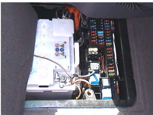
Foto 1 Zekeringenkast