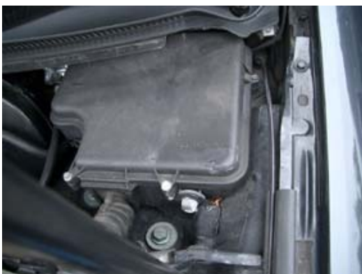
Zekeringenbox in waterreservoir (Audi A6)

De aansluiting voor het voedingsrelais bevindt zich in de zekeringenbox in het waterreservoir.