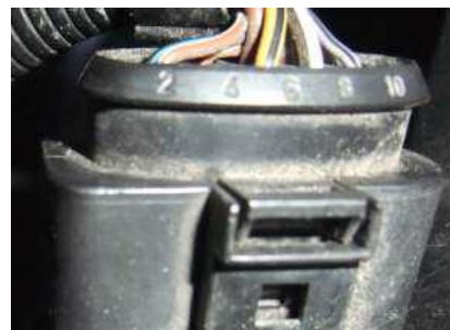
Figura 2: Connettore a 10 poli