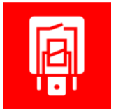
Fig. 2 esquema de conexiones delante Fig. 3 esquema de conexiones detrás