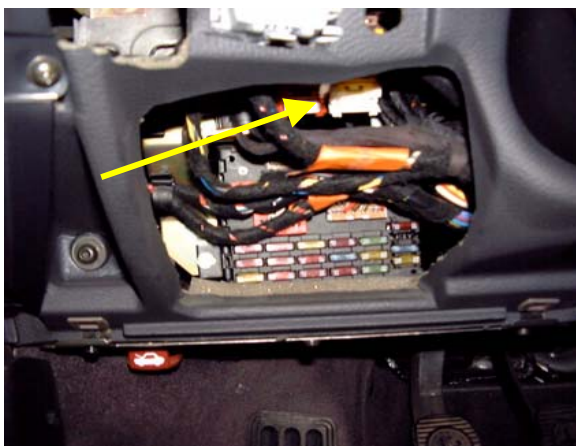
Fig. 1: ABS-sikring: Under instrumentbrættet, til venstre for ratsøjlen (LHD)

Hvis sikringer svigter gentagne gange, må yderligere fejlsøgning kun foretages i henhold til fabrikantens kontrolanvisninger og med inddragelse af ledningsdiagram. Desuden bør fejllageret udlæses med et egnet diagnoseværktøj.