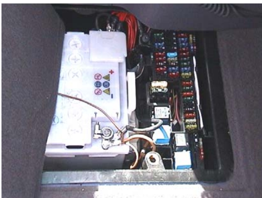
Fig. 1 Sikringskasse