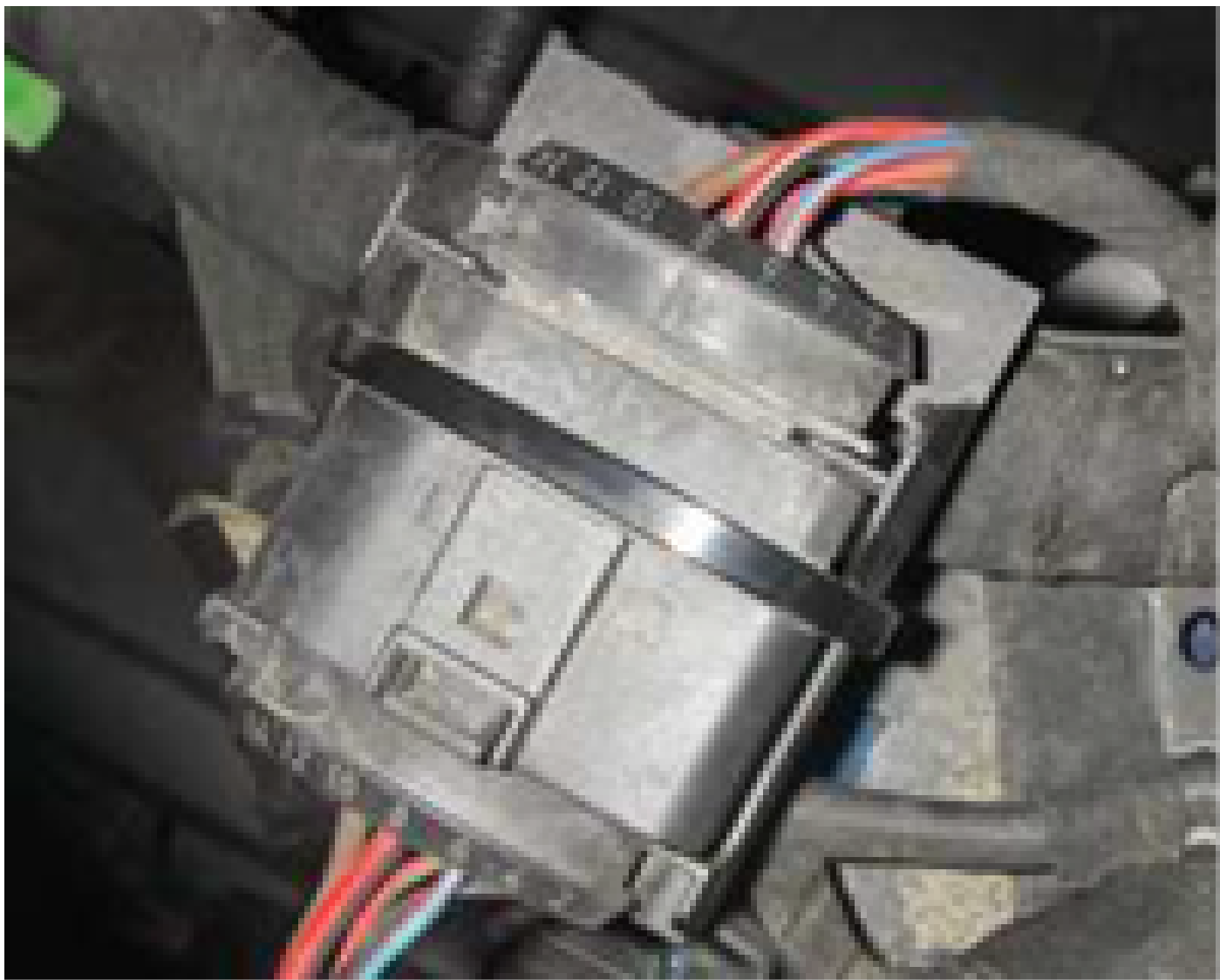
Abbildung 2.: Stecker 10 polig