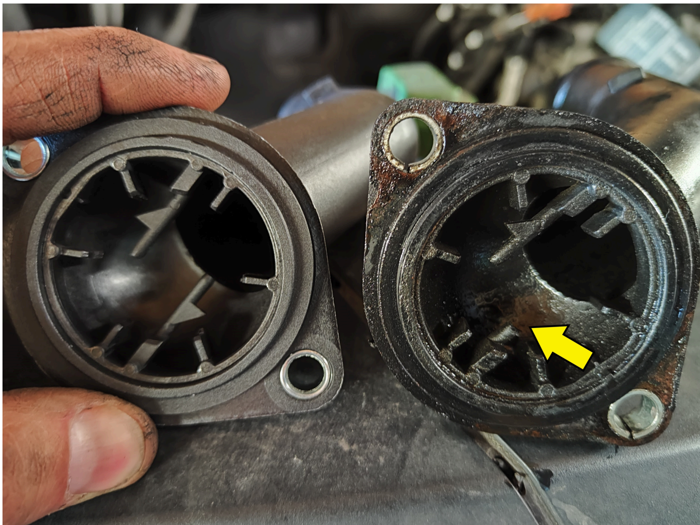
Kunststoffführung T5 Kühlmittelflansch