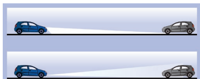
Abb.: Systemvergleich Abblendlicht gegenüber Tagfahrlicht

min. = minimaler Abstand max. = maximaler Abstand